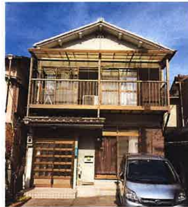
ちやれんじホームの建物