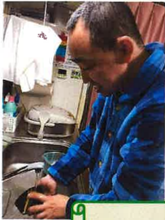
できることが たくさん増えたよ♪