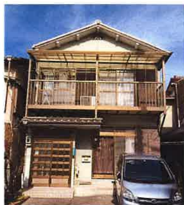
ちゃれんじホームの建物