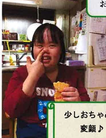
少しおちゃめに 変顔♪