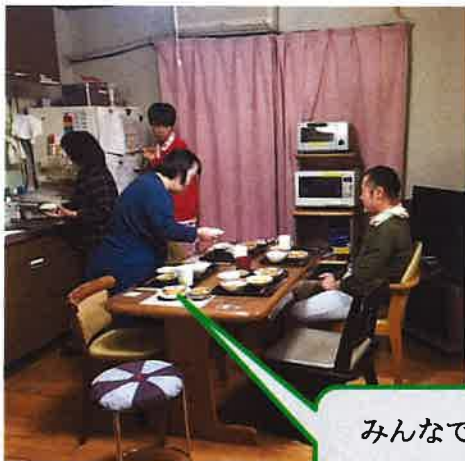
みんなで お手伝い