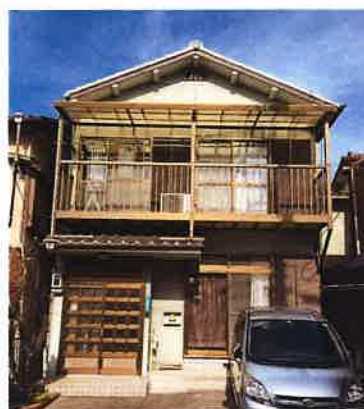
ちやれんじホームの建物