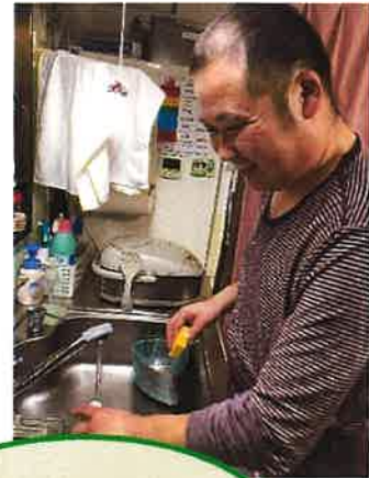
自分の事は 自分でします！